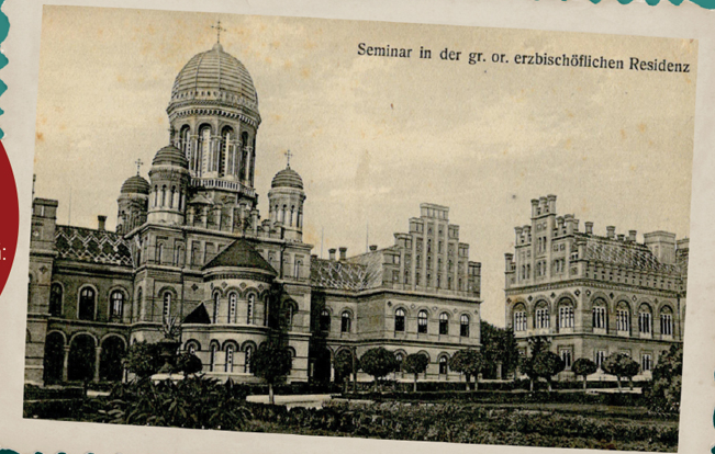
Seminarul de la Cernăuți

Cântec de mai, Marș festiv și valsurile Răsunete carpatine, Un vis de fericire.