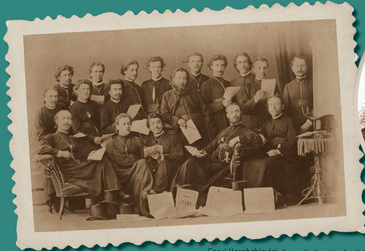
Corul Vorobchievici.